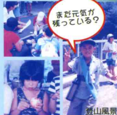
まだ元気が残っている?