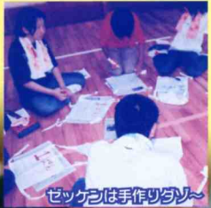
ゼッケンは手作りタリ〜