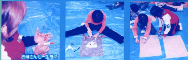
お母さんも一生命