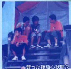
登った後放心状態?