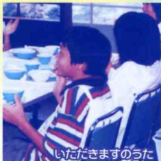
いただきますのうた

県リーダー研 (広島県子ども会リーダー研究集会) と き: 平成14年8月2日(金)~4日(日) と ころ: 三滝少年自然の家