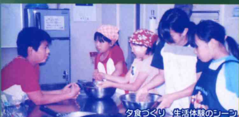
夕食づくり 生活体験のシーン