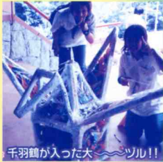
千羽鶴が入った大〜ツル!!