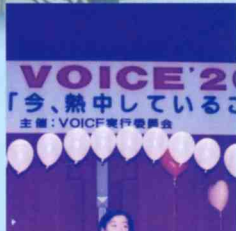
「今、熱中していること」 主催: VOICF実行委員会