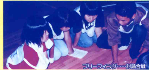
フリーファイティング……討論合戦