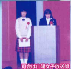
司会は山陽女子放送部